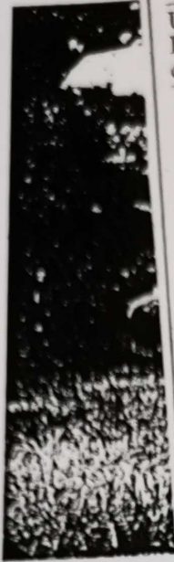
« Les cinq saisons »

Sans processus complexe de moulage et de coulage, sans cuisson, qui réduisent toujours le souffle de l'original, le fluide passe sans intermédiaire du créateur au spectateur. En essayant ainsi d'insuffler la vie au béton, je me sens plus proche du souffleur de verre que du tailleur de pierre.