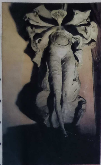
Mater Magna

U ne âme tout entière qui pense. De la vie au bout des doigts. De la vie extirpée, travaillée dans un des matériaux les plus inattendus chez un sculpteur : le béton. De ce béton, symbole de la techni-