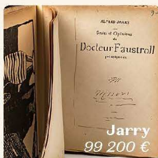
Jarry 99 200 €