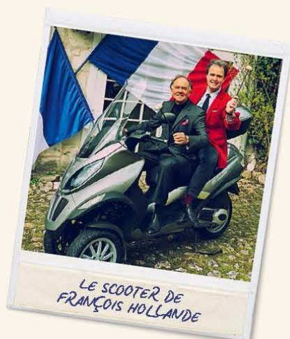
LE SCOOTER DE FRANÇOIS HOLLANDE