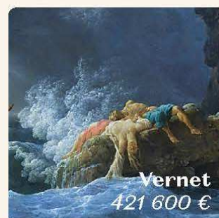
Vernet 421 600 €