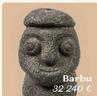
Barbu 32 240 €