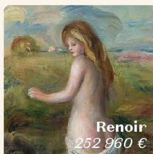
Renoir 252 960 €