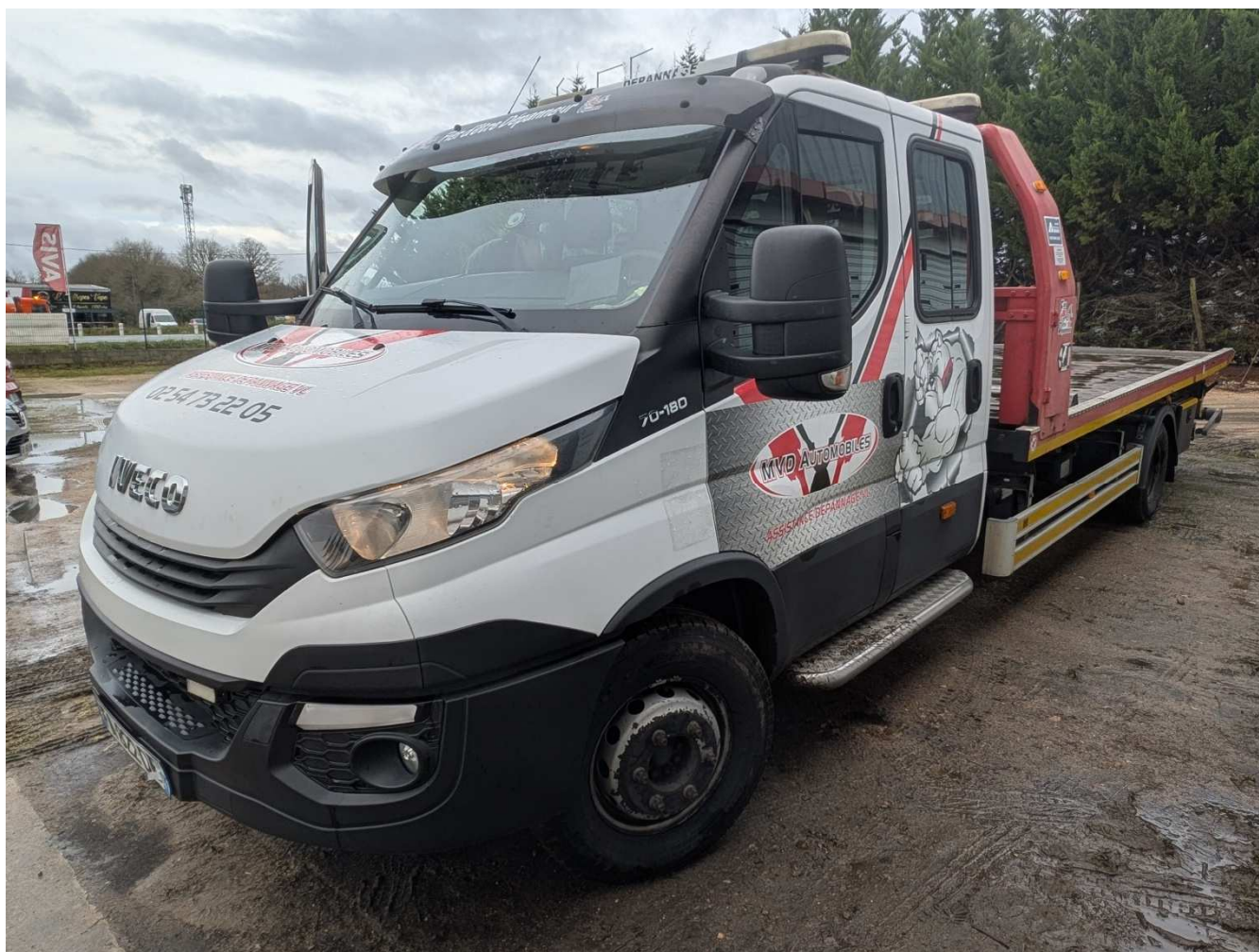
N°8 - Dépanneuse Iveco Daily IS70