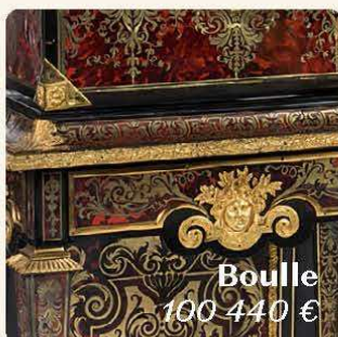
Boulle 100 440 €