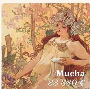
Mucha 33 380 €