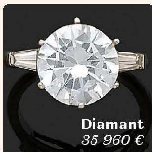
Diamant 35 960 €