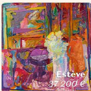
Estève 37 200 €