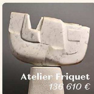
Atelier Friquet 136 610 €