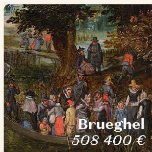
Brueghel 508 400 €