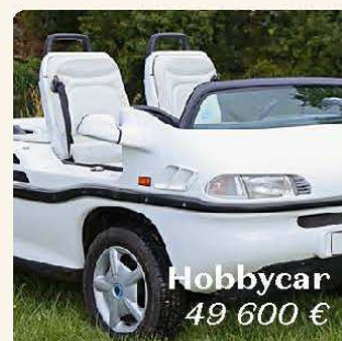
Hobbycar 49 600 €