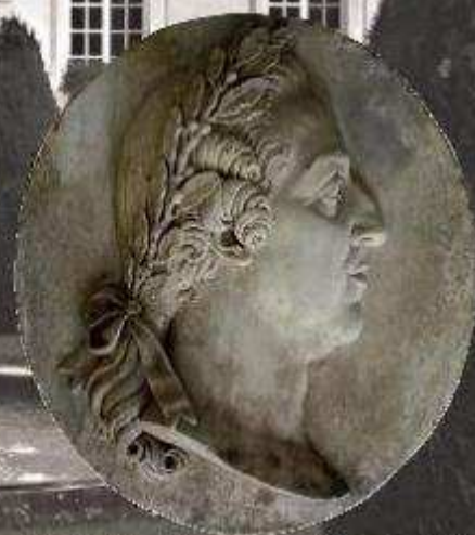
Profil du bien-aimé roi Louis XV