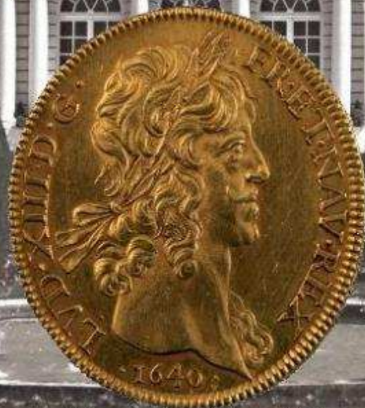
Pièce de plaisir de Louis XIII*