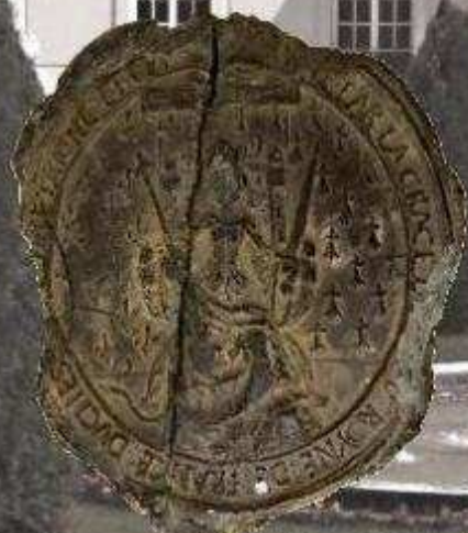
Grand sceau de deuil d'Anne de Bretagne